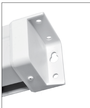
Boční víko tubusu slouží zároveň jako uchycení ke stěně / stropu