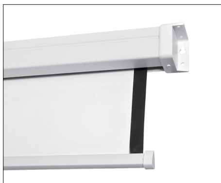
Boční ohraničení projekční plochy černými pruhy